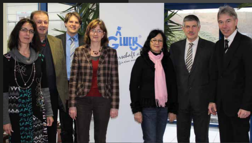
Firmenbesuch bei August Gluck GmbH & Co. KG in Schlitz-Rimbach.