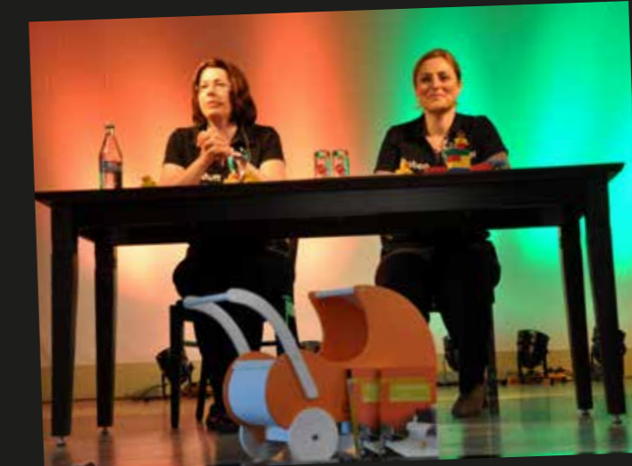
Lesung „Muttertier @ Rabenmutter“ in Lauterbach-Maar.