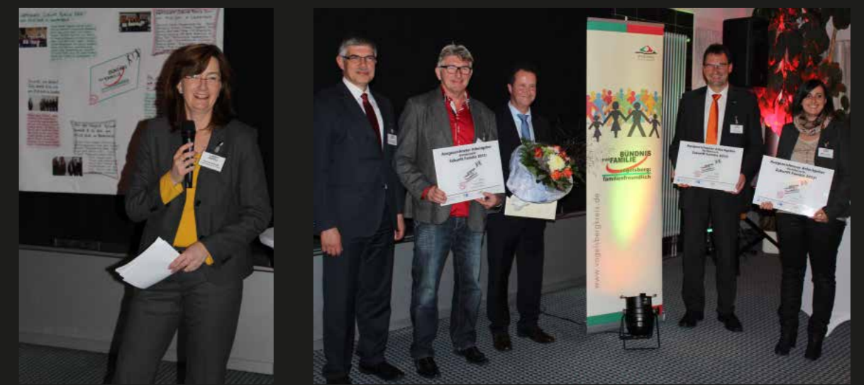
Abschlussveranstaltung „Zukunft Familie 2013“ in Lauterbach.