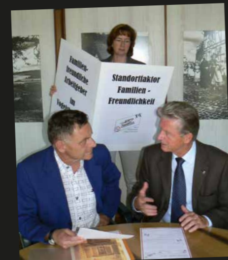
Auftakt zum Wettbewerb „Zukunft Familie - familienunterstützende Maßnahmen am Arbeitsplatz“