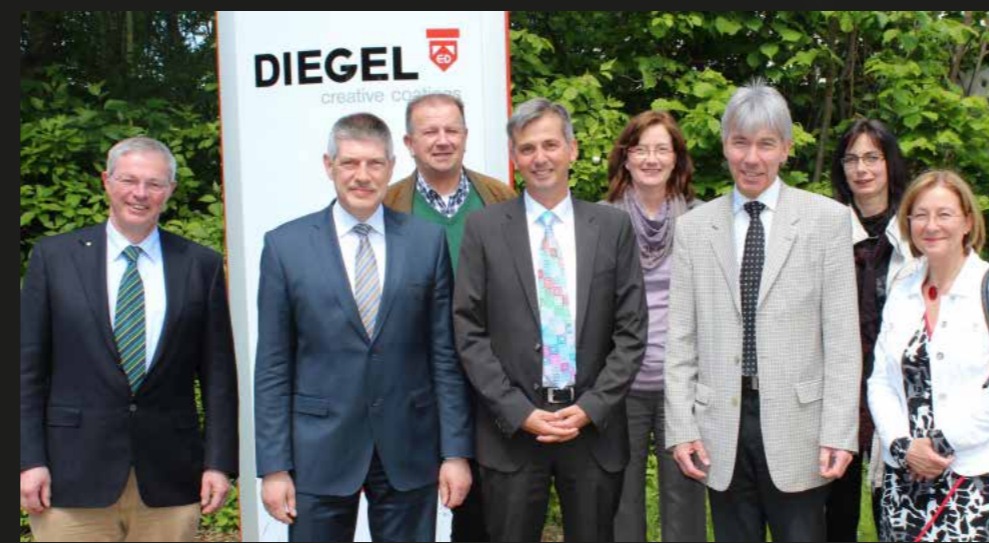
Firmenbesuch bei Ernst Diegel GmbH in Alsfeld.