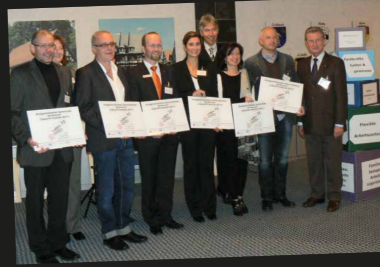
Die Gewinner des Wettbewerbs 2011 bei der Abschlussveranstaltung.