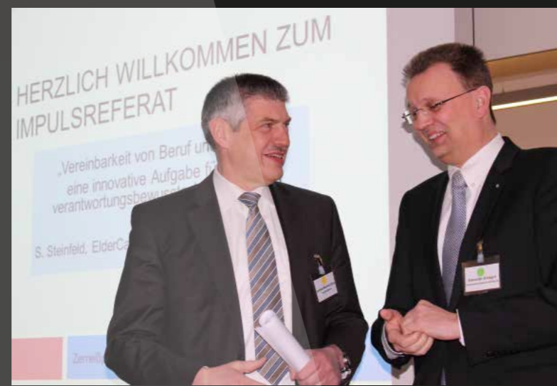
Veranstaltung „Zerreißprobe Pflege & Beruf“ in Lauterbach.