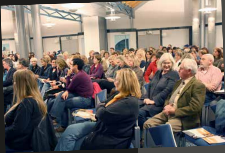
Veranstaltung „Work-Life-Balance“ in Lauterbach.