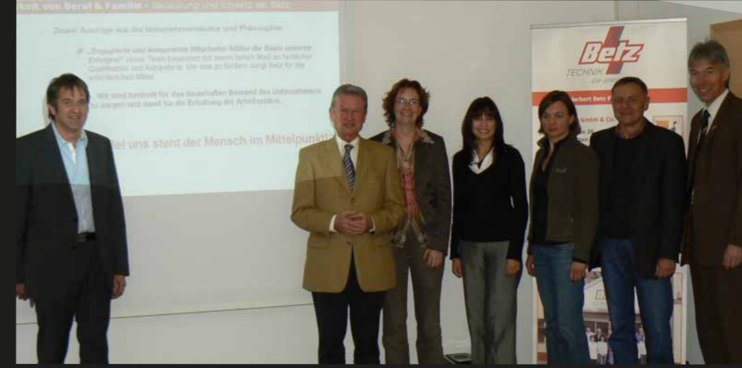
Firmenbesuch bei Herbert Betz GmbH & Co. KG in Schotten-Eschenrod.