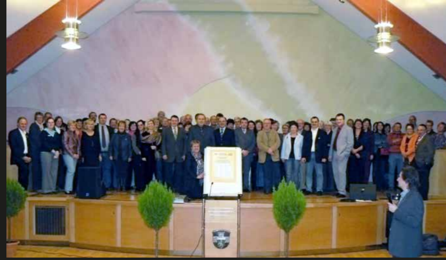
Die Gründungsmitglieder bei der Auftaktveranstaltung in Romrod.