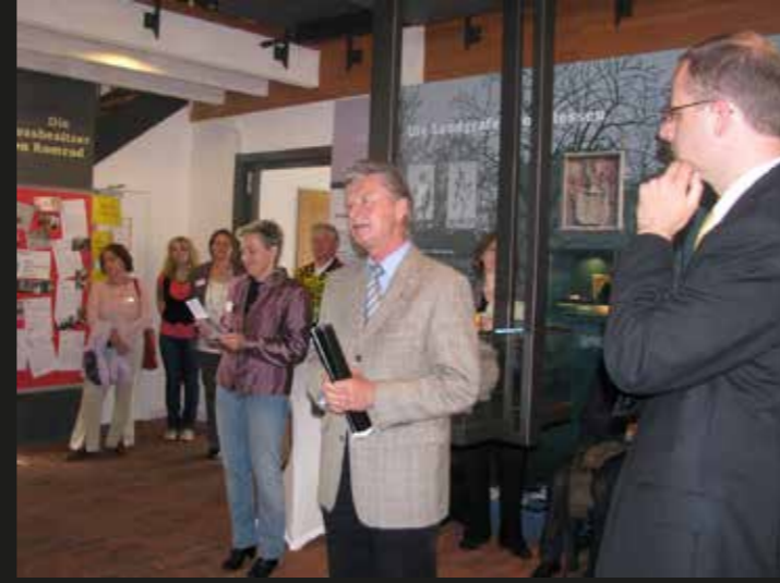
Veranstaltung am 15. Mai 2009 im Mehrgenerationenhaus Romrod: „Zeit für Familie und Beruf“.